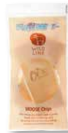
MOOSE Chips 2 piezas