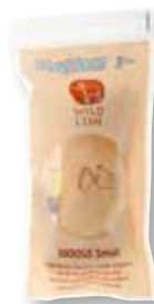
MOOSE Small 1 pieza