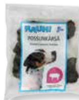
RAUH Hocicos de cerdo 120 g