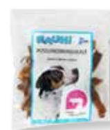
RAUH Orejas de cerdo en tiras 75 g