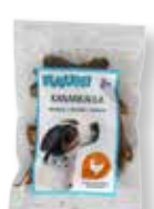
RAUH Cuellos de pollo 105 g