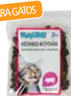
RAUH Pulmón & Corazón 90 g