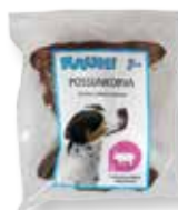
RAUH Orejas de cerdo 130 g/ 280 g

CONTENIDO DE NUTRIENTES: Consulta el envase