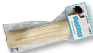
COW Medium 1 pieza