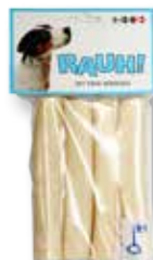
COW Bastones de energía 4 piezas