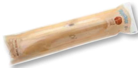
MOOSE Large 1 pieza