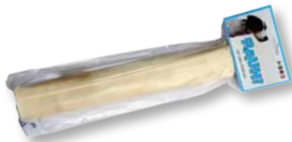
COW Large 1 pieza