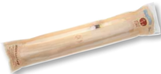
MOOSE Extra Large 1 pieza