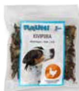
RAUH Mollejas 120 g